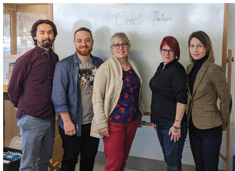
Cercle Charlevoix «Le cercle nature»