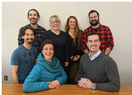
Cercle Côte-de-Beaupré «MC_december»

Les projets portés par les promoteurs représentent plusieurs secteurs d'activités dont voici la liste: Agroalimentaire | Distillerie | Service en relation d'aides | Produits naturels de soins du corps | Ostéopathie | Joaillerie | Atelier méditation | Service conseil gestion | Sonorisation | Produit forestier non-ligneux | Savonnerie - Parfumerie | Location de jouets | Récréotouristique